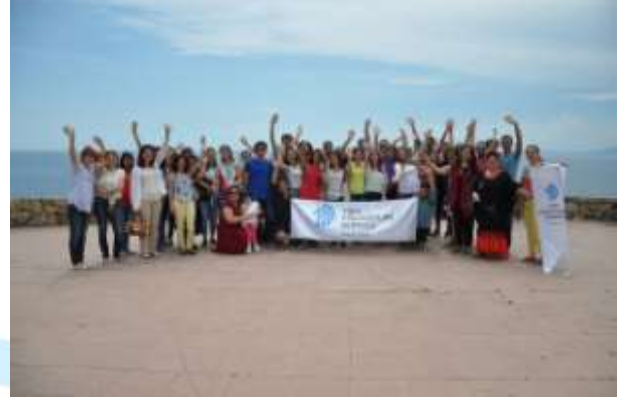
TPD Antalya Şube

TPD 33. Olağan Genel Kurulunda Samsun ve Antalya illerinde TPD'nin şubelerinin kurulması kararı alınmış ve gerekli işlemlerin başlatılmasının ardından 26 Ağustos 2014 tarihinde TPD Antalya Şube ve 9 Ekim 2014 tarihinde TPD Samsun Şubeleri resmi olarak kurulmuşlardır