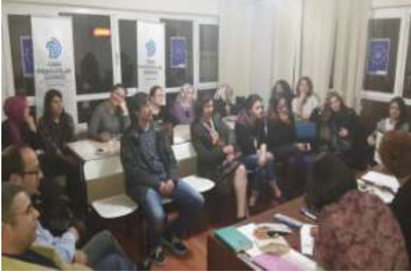
TPD Samsun Şube