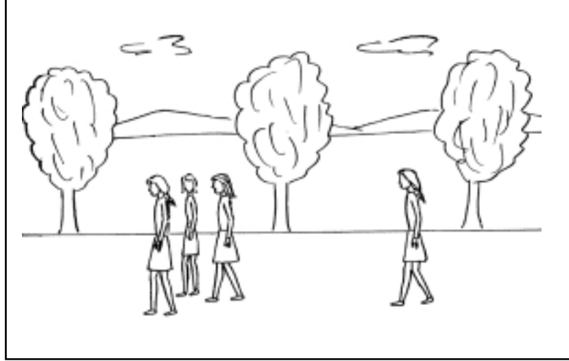
Resim 1: Kişisel nedensellik yükleme eğilimine ilişkin (kız öğrenci formu) örnek